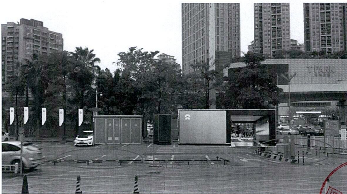
惠州海关口岸广场蔚来充换一体站布局方案